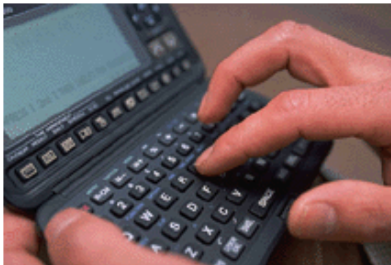
Caption describing picture or graphic.